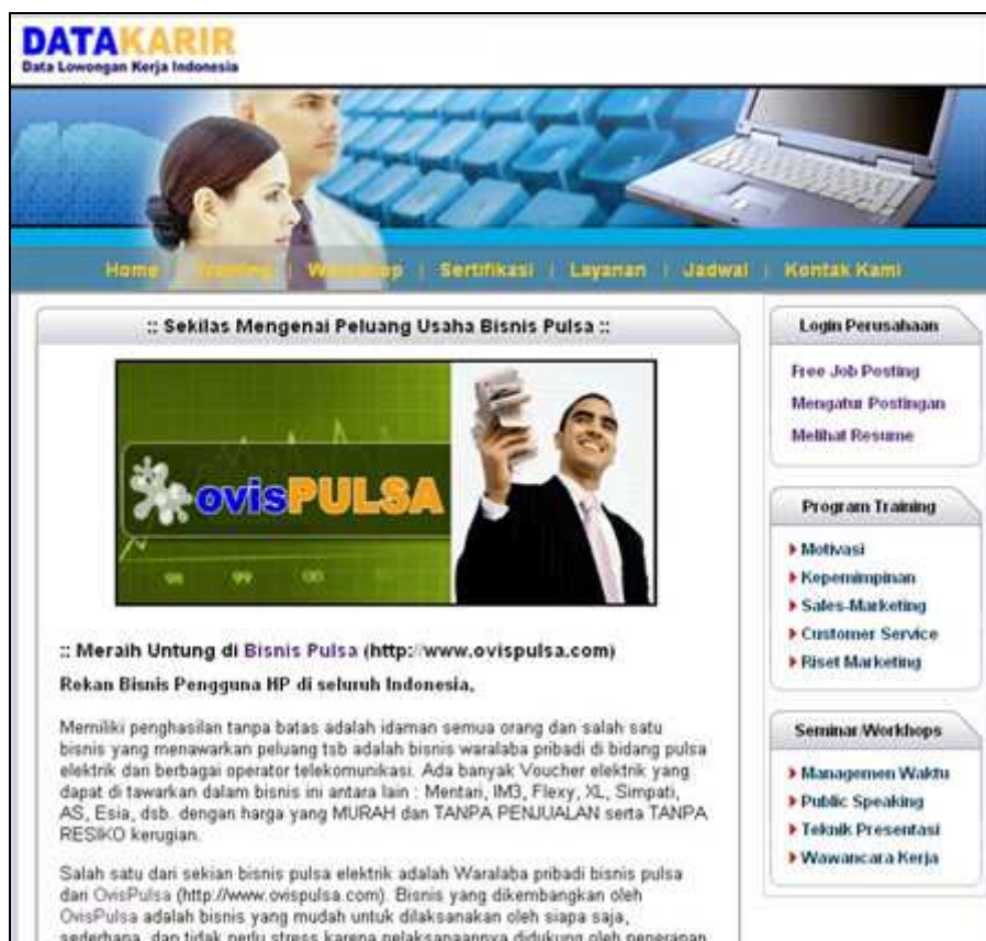
Gambar 4 – Iklan dalam bentuk Artikel

Salah satu strategi e-marketing yang sangat efektif adalah iklan dalam bentuk artikel yang isinya merekomendasikan produk atau jasa yang dimiliki oleh Anda. Artikel dalam bentuk rekomendasi ini memiliki impact yang besar untuk menumbuhkan keyakinan konsumen terhadap manfaat produk atau jasa Anda dan juga tentunya kredibilitas Anda. Materi iklan dalam bentuk tulisan yang bisa Anda lengkapi dengan gambar dsb. Kemudian kami akan memberikan teks link bagi halaman artikel tsb di halaman homepage dan halaman informasi lowongan kerja agar mudah diakses oleh pengunjung. Biaya Rp. 400.000,- per-bulan.