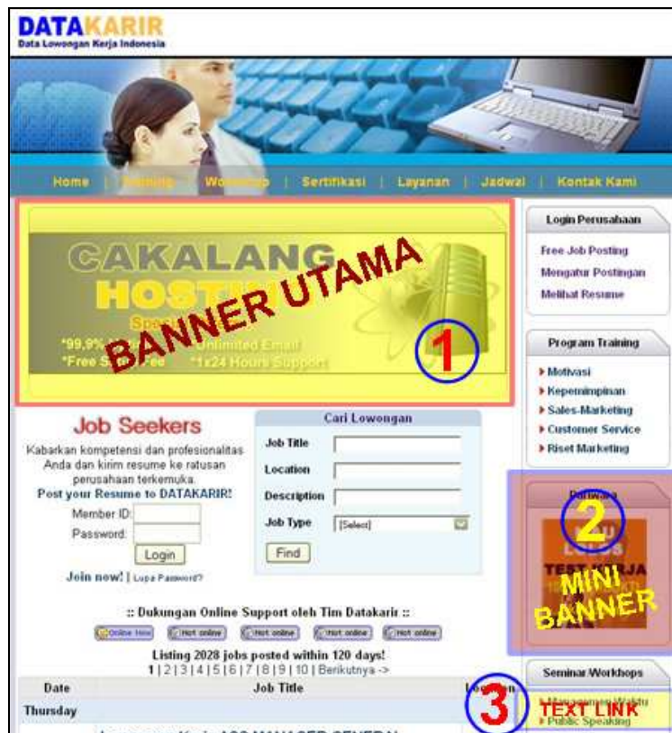
Gambar 2 – Tiga (3) tawaran iklan yang terletak di halaman homepage